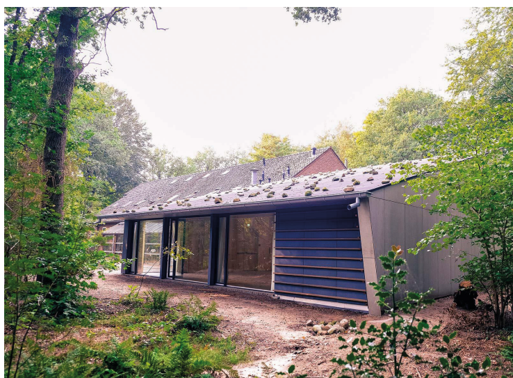
De Buitenzaal met op de achtergrond gebouw 2